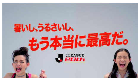
第49回 Jリーグ 「暑い、うるさい、 もう本当に最高だ。」