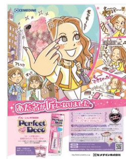
第49回 セメダイン 「あだ名が 匠になりました。」