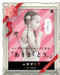
第49回 アテックス 「マッサージは メッセージになる」